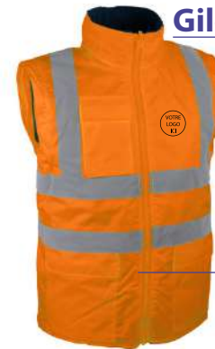
Gilet Polaire HV