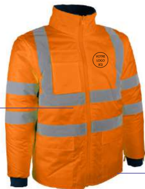
Blouson Polaire HV