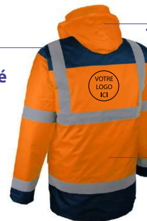
Le tout assemblé